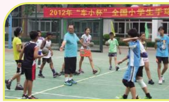
张王乐心老师供稿

经过几天的激烈角逐,青岛镇江路小学代表队分别获得女子甲组第八名,男子甲组第十名的好成绩。本次比赛,我校手球队队员们以出色的表现全面展示了高超的技战术水平、坚韧的意志品质和良好的道德风尚,也充分体现了学校手球运动的蓬勃发展。